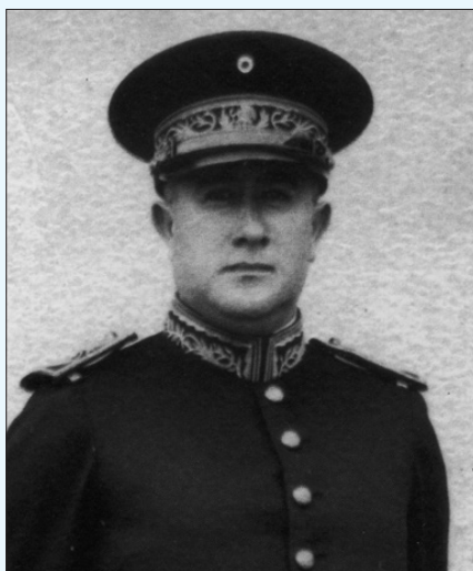
MAXIMINO Ávila Camacho (1881-1945). Fue gobernador de Puebla de 1937 a 1941. Convirtió al Colegio del Estado en Universidad de Puebla.