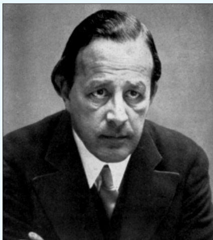
EMIL Ludwig (1881-1948). escritor y biógrafo alemán de origen judío, famoso especialmente por sus obras sobre Beethoven, Goethe y Napoleón.