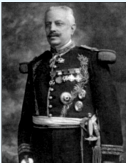
GENERAL Aureliano Blanquet. Militar porfirista. Combate a Madero, aprehendiéndolo durante la Decena Trágica. Su odio por los revolucionarios se manifestó desde mediados de 1911 en Puebla.