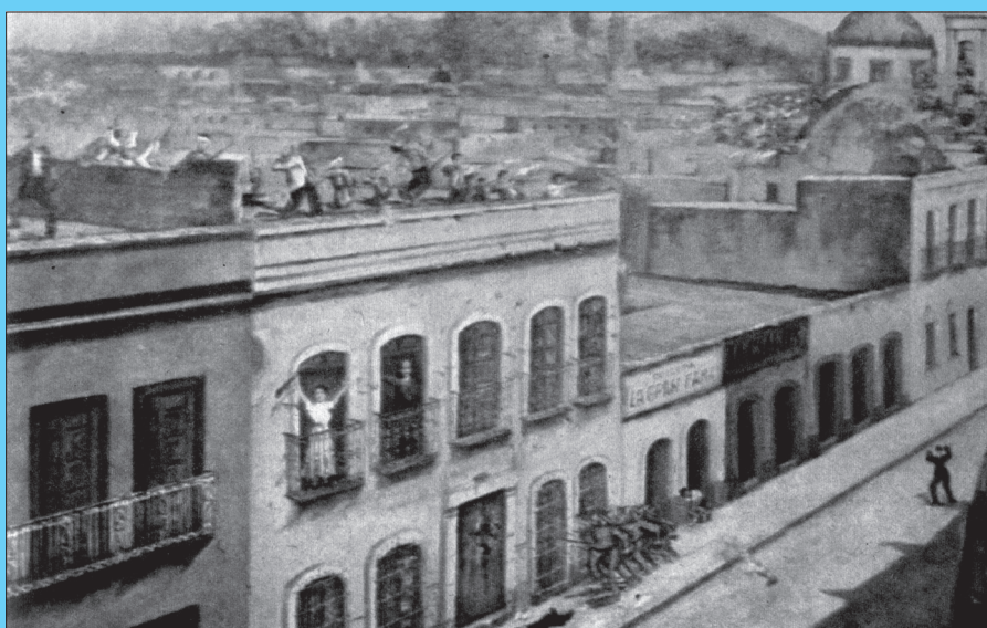
ASALTO a la casa de los hermanos Serdán el 18 de noviembre de 1910.

En su número 10 de 2008, Tiempo Universitario publicó el artículo “Fraude electoral y los Estudiantes del Colegio del Estado en 1910”, de Arturo Garmendia, donde se analiza el impacto que tuvo la visita de Francisco I. Madero a Puebla, el 15 de mayo de 1910, así como el apoyo de estudiantes del Colegio del Estado a la lucha contra el fraude electoral de 1910 que pretendía imponer una nueva reelección de Porfirio Díaz como presidente de la República. En el presente trabajo se rescata lo concerniente a Puebla, a partir de 1910, en la obra La verdadera revolución mexicana , 1 del escritor y periodista Alfonso Taracena (Cunduacán, Tabasco 1986; México, 1995); quien fuera quizás el más acucioso cronista de la vida política que vivió el país en esos años. La obra es una cronología de los sucesos de 1901 a 1940.