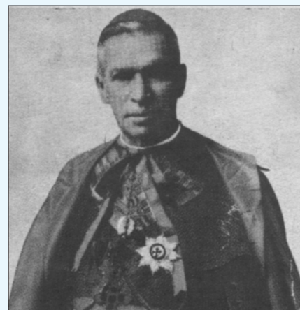
RAMÓN Ibarra y González, primer arzobispo de Puebla de 1902 a 1917.

El 12 de julio, sale Madero en ferrocarril hacia Puebla, donde “...surge un tremendo choque entre federales y revolucionarios; éstos, excitados por unos disparos dirigidos hacia ellos por un hijo del gobernador