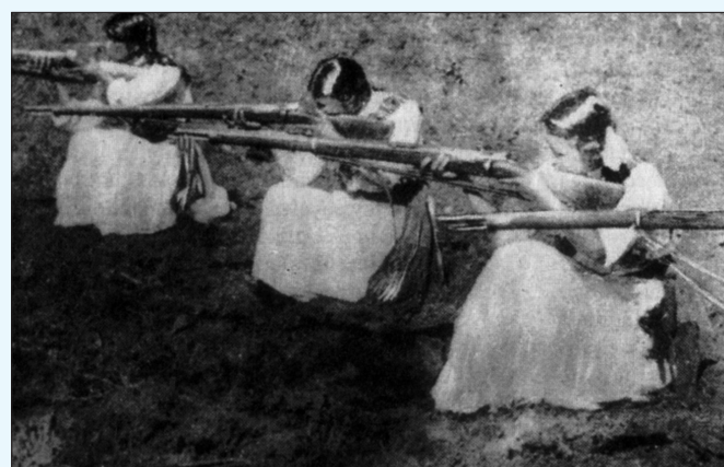
MUJERES revolucionarias. Foto Revista Proceso . Bicentenario, La mujer en la revolución. Fascículo 3, junio 2009.

"Alarma en Puebla ante la falsa noticia de que el Patriarca Pérez estaba en esa ciudad con varios cismáticos y que el primero que ocuparía sería el templo