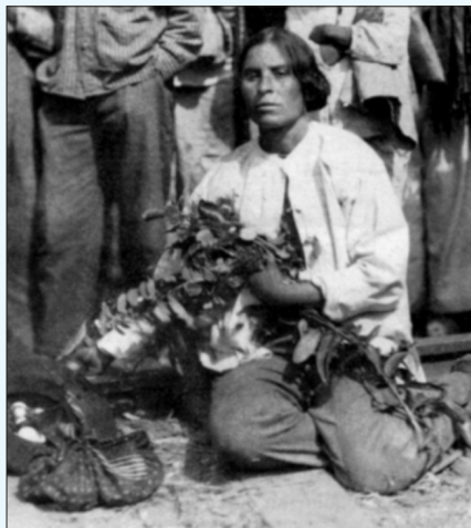
MUJERES en la Revolución

Además, Flores Magón celebró ayer un mitin en San Martín Texmelucan, en el que llamó al presidente