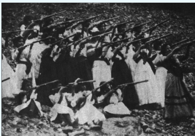
MUJERES revolucionarias. Foto Revista Proceso . Bicentenario, La mujer en la revolución. Fascículo 3, junio 2009.

"Junio 15. Decreta el Juez Supernumerario de Distrito de Puebla la absoluta libertad de Enrique Flores Magón. El agente del Ministerio Público Federal adscrito desistió de la acusación y a las cuatro de la tarde sale de la Penitenciaría el líder socialista. Con este motivo, los directivos de la Confederación Sindicalista del Estado de Puebla, suspenden la manifestación de protesta que preparaban, y así se hace saber a los obreros de Atlixco y de otros lugares. También en la ciudad de México se detienen los preparativos para otra manifestación obrera de solidaridad". 20